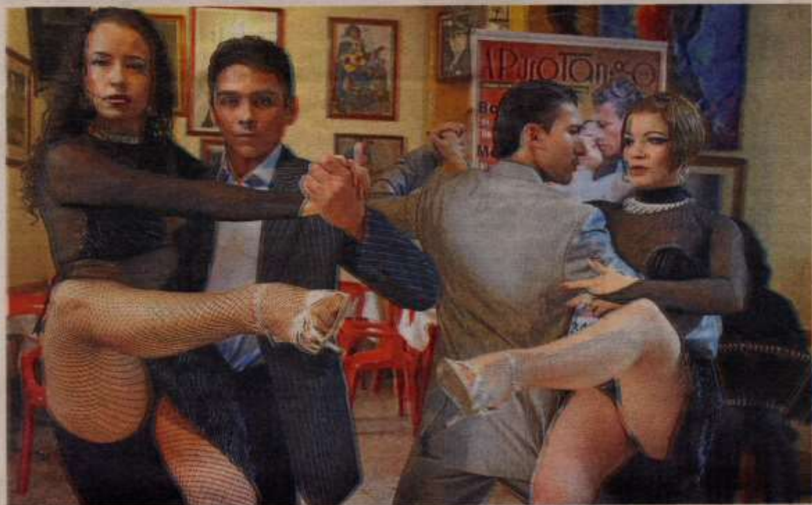
Ver la compañía 'A Puro Tango' constituye un auténtico deleite para la vista. Hay peso narrativo y actoral en escena.