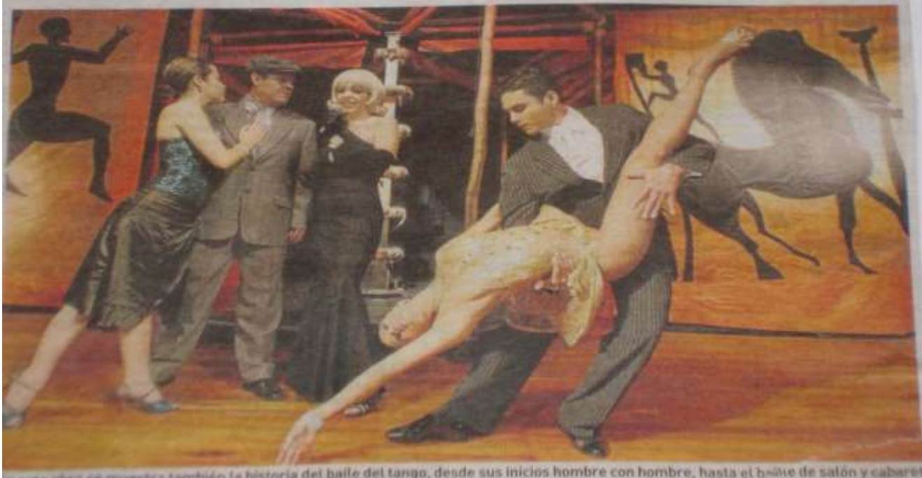
En esta obra se muestra también la historia del baile del tango, desde sus inicios hombre con hombre, hasta el baile de salón y cabaret.

El espectáculo tiene otros ingredientes importantes como el humor, que contrasta con la parte dramática; la sensualidad y la interacción con el público, donde se rompe la cuarta pared y pasan a ser unos bailarines más de la obra, al estilo de una milonga.