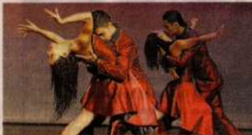
El montaje ya estuvo con éxito en Barranquilla.

Esta obra se hace en homenaje a quien fue uno de los mejores tangueros en la capital antioqueña. A puro Tango es una reconocida compañía que tiene 10 años trabajando por la cultura y la música.