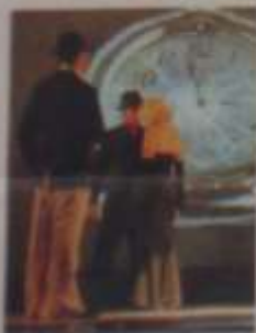
La compañía antioqueña A. Puro Tango realizará los bailes.